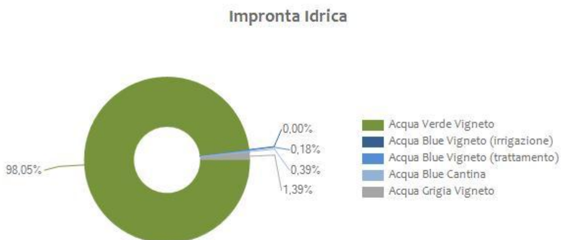
Figura 1 Valori percentuali dell'impronta idrica verde, blu e grigia per una bottiglia di Barbaresco Asili 2013 .